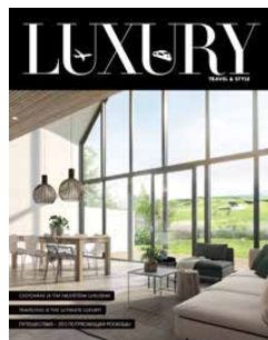
LUXURY TRAVEL & STYLE