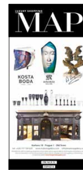
LUXURY SHOPPING MAP