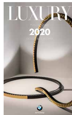
DESIGN & DEVELOPER